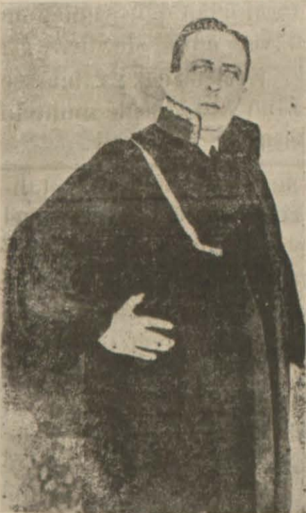
Değerli C. M. umumisi Şeref bey diyorum. Kalın kafalı hâlâ Türkçe — Gerisi 2. ci Sayfada —

Bu ihtar karşısında asabileşen Matmazel bir çok manasız hareketlerle istihafa başlamış, bu cüretini daha ileride götürerek az ötede bulunan köpeğini yanına çağırarak: "Pis köpek sana Türkçe konuş"