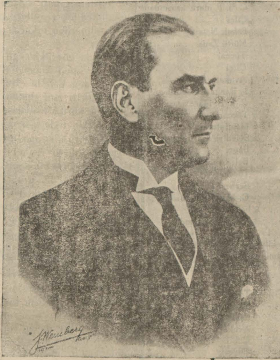
C. H. Fırkasının büyük Kurucusu ve Önderimiz GAZİ Hz